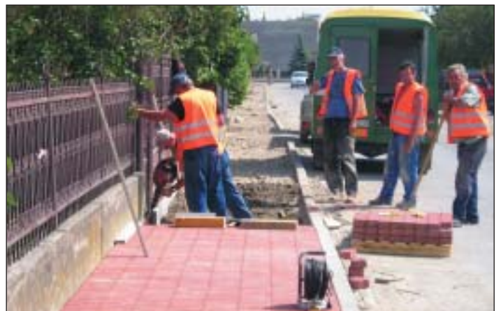
Jednou z hlavných investičných akcií počas letných dní bola rekonštrukcia chodníkov na Ukrajinskej, Minskej a Adamovej ulici. Náš záber je z prác na Minskej ulici

Každý človek sa môže zamračíť, ale aj usmiať. Hundrať, ponosovať sa, ale aj pochváliť. Priniesť búрку, ale aj vyjasnenie. „Keď odchádzali“ - hovorí starozákonný žalmista - idúcky plakali a osivo niesli na siatie. No keď sa vrátia, vrátia sa s jasotom a svoje snopy priniesú.“ Možno je to rada aj pre nás, aby sme nezabúdali, že život má aj svoje dobré stránky. Aby sme rozmýšľali a rozprávali aj o nich. Aj u nás, v Krásnej.