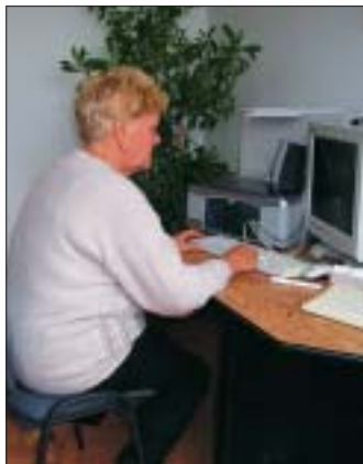
Na zábere jedna z účastníčok kurzu

Teší nás záujem, s ktorým dôchodcovia prichádzali, ale aj to, že napriek tejto uponáhľanej dobe mali snahu naučiť sa nové veci, no vôbec nie kvôli sebe. Robili to kvôli svojim vnúčatám a deťom, ktoré sú roztrúsené po celom svete a jedinou možnou cestou ako s nimi hovoriť takmer z očí do očí je dnes prenos cez internet. Aspoň takto na chvíľu ich budú mať „doma“.