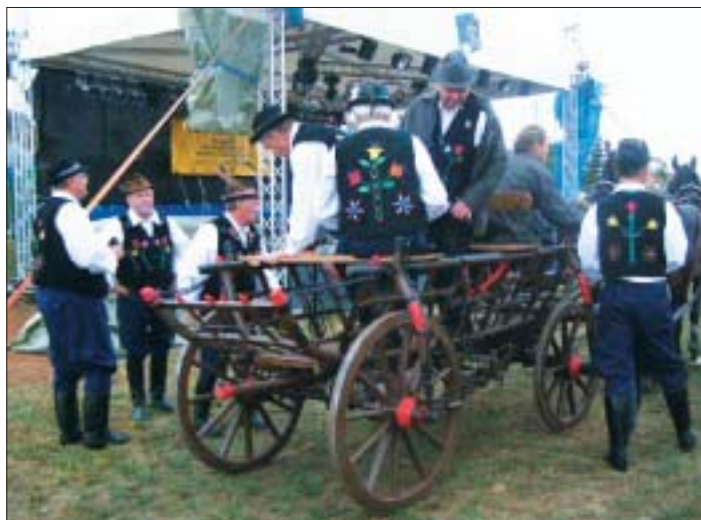
Večernému galakonzertu predchádzala jazda na rebrňáku, z ktorého členovia Krasňanky pozývali obyvateľov na folklórne vystúpenie FEMANU

ne Krásna už akúkoľvek inú náročnú organizačnú úlohu.