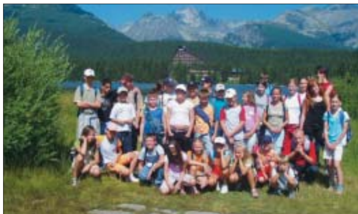
Najväčší záujem bol o výlety vo Vysokých Tatrách. Na zábere detí s animátormi na Štrbskom plese