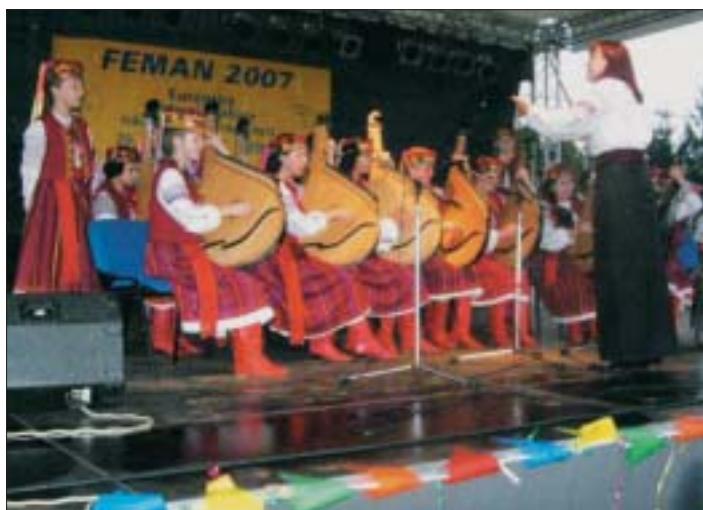
Ako prvý sa na ôsmom ročníku FEMANU predstavil ukrajinský súbor

boli rozdelené a plnené podľa harmonogramu. Jeden z usporiadateľov mi vyrazil, že jeho povinnosti siahajú až do tretej hodiny po polnoci. Osobne som presvedčený, že po tejto TOP akcii európskeho rozmeru zvlád-