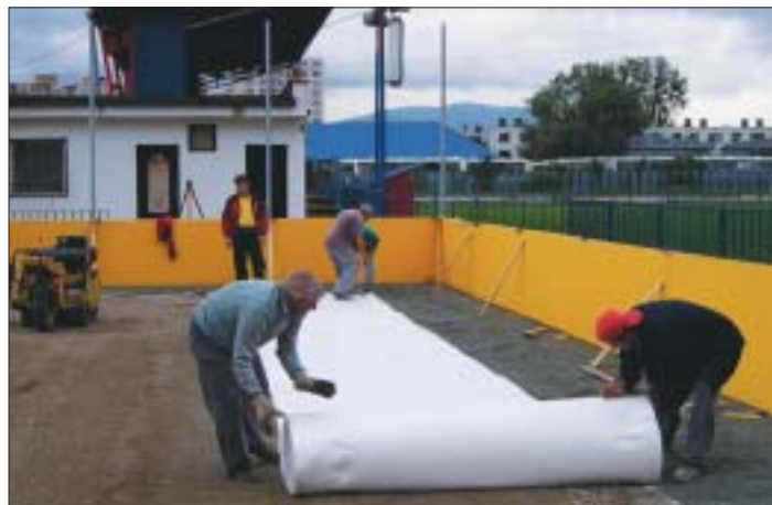
Náš záber z miestneho ihriska približuje pracovníkov firmy HYDRO – EKO – STAV pri pokladaní geotextílie pod umelú trávu

Aj tento rok sme sa statočne vyhýbali vážnejšej ujme na zdraví. Ale našli sa aj takí, ktorí mali me-