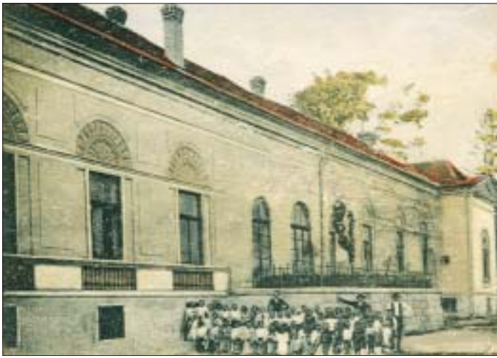
Pohľad na niekdajšiu školu – začiatok dvadsiateho storočia