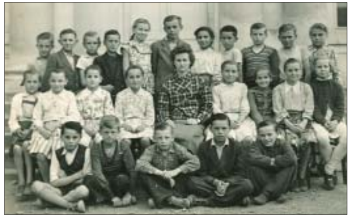
Ach ten čas tak letí, tak letí, dávno sa nám vzdialil svet detí. Veru dávno. Na tomto obrázku ste ako piataci mali dvanásť. Dnes o päťdesiatku viac. Náš záber je totiž z roku 1957 (bič)