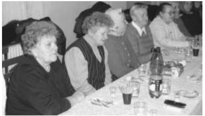
Posedenie seniorov pri rozlúčke so starým rokom