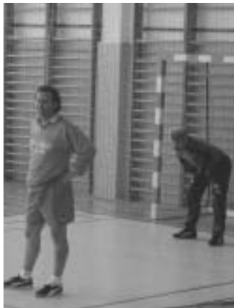
Jedna zo situácií na druhom ročníku halového futbalového turnaja v Košiciach

Košice - mestská časť Krásna leží 191 m nad morom. Najstaršia písomná zmienka je z roku 1143, kedy bolo vysvätené krásňanské opátstvo - benediktínsky kláštor s patrocíniom P. Márie. Už v čase jeho rozvoja tu vznikli dve samostatné dediny Krásna a Opátska, v stredoveku známe vinohradníctvom. Krásna nad Hornádom vznikla spojením už spomínaných obcí v roku 1945. Súčasťou mesta Košice sa stala v roku 1976. Heraldická komisia v roku 1997 potvrdila Krásnej erb a zástavu.