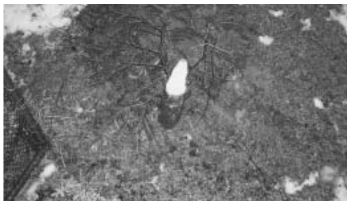
Krádež vianočného stromčeka na cintoríne. Je to na zaplakanie!