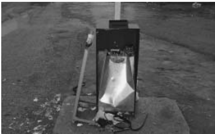
Vandali opäť „úradovali“ aj na Silvestra