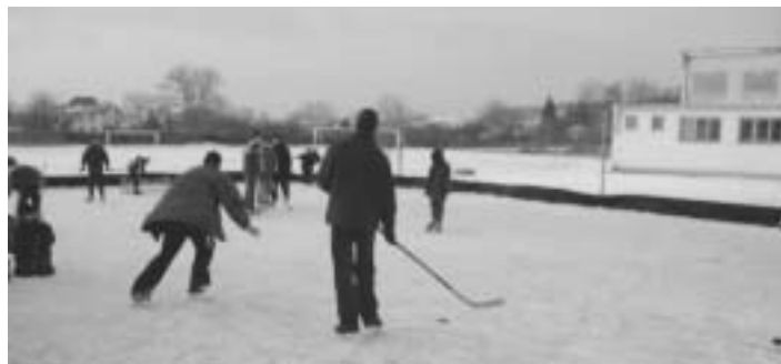
Klisko fungovalo opäť aj v tejto sezóne

• Kúpime menší rodinný dom, maximálne 15 ročný. mobil č. 0918 495 652