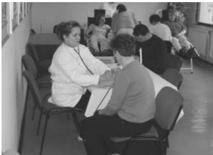
Tak to vyzeralo na minuloročnom odbere krvi