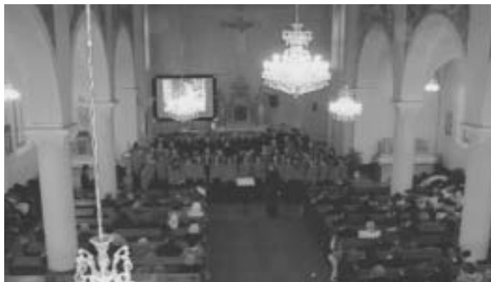
Z vystúpenia speváckeho zboru počas vianočného koncertu v našom kostole