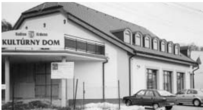
Súčasný pohľad na budúcu dominantu obce Košice-Krásna – miestny úrad a kultúrny dom vo výstavbe.