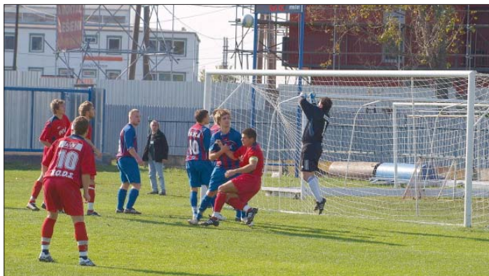
Jedna z ošemetných situácií pred bránkou počas futbalového duela Krásna - Barca 0:0

Vo všetkých stretnutiach sme boli vyrovnaným mužstvom našim súperom. V zápasoch v Spišskom Podhradí a doma s Lokomotívou Košice sme zbytočne inkasovali po vyrovnanom priebehu v posledných piatich minútach zápasu a oba sme prehrali 1:0. V Snine, Veľkom Šariši a doma s Barcou sme predovšetkým nepresnosťou vo finálnych prihrávkach a nedôraznosťou v pokutovom území súperu prišli o možnosť zisku bodov, ktoré by nám pomohli pohybovať sa v pokoj-