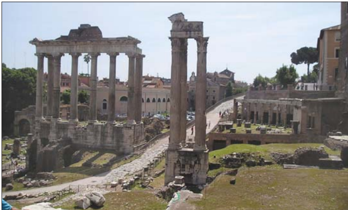
Centrum starovekého Ríma – Fórum Romanum, dole pohľad na známe Koloseum, vpravo najznámejšia fontána v Ríme – Fontána di Trevi.

slávnou Sixtínskou kaplnkou by bola škoda. Neveril by som, že prehliadka najväčších historických skvostov v oblasti archeológie, maliarstva, sochárstva bude trvať viac ako tri hodiny. Chodby týchto múzeí sú kilometre dlhé a len pri bežnej chôdzi, bez mimoriadnych prestávok nám táto fascinujúca