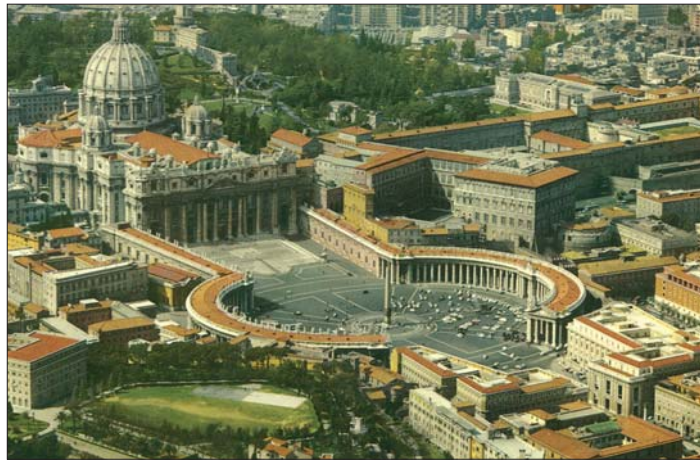
Námestie sv. Petra otvára náruč všetkým návštevníkom „Večného mesta“