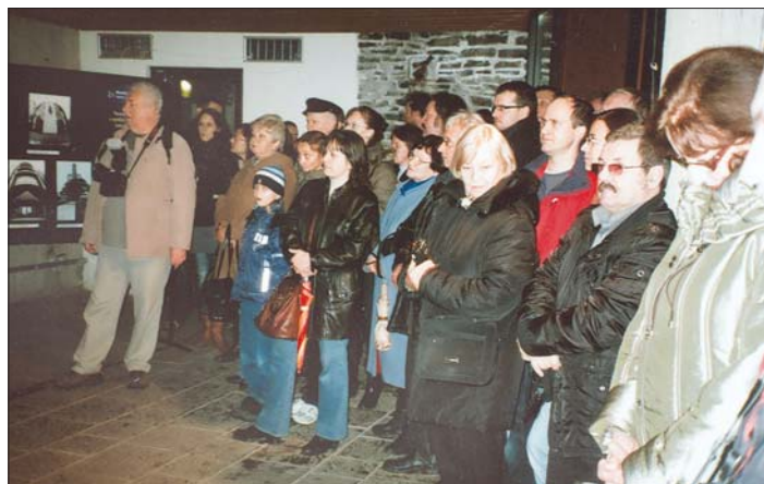
Skupina z početných návštevníkov vernisáže v deň výročia „nežnej revolúcie“, dňa 17. novembra 2009 v priestoroch Archeologického múzea, Dolná brána v Košiciach.