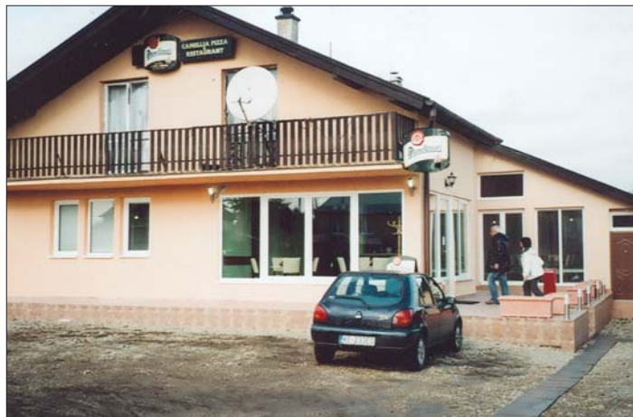
Pohľad na reštauráciu „Camellia“ z Ukrajinskej ulice, tesne po jej sprístupnení verejnosti, v ktorej od 13. novembra 2009 ponúkajú raňajky, obedy aj večere.

vane vedeniu obce, všetkým, ktorí mu vyšli v ústrety pri uskutočnení jeho zámeru, totiž urobiť čosi odlišné, nevšedné, špecifické a príťažlivé pre ľudí takmer štyri tisícovej obce, aj pre tých, ktorí ju navštevujú