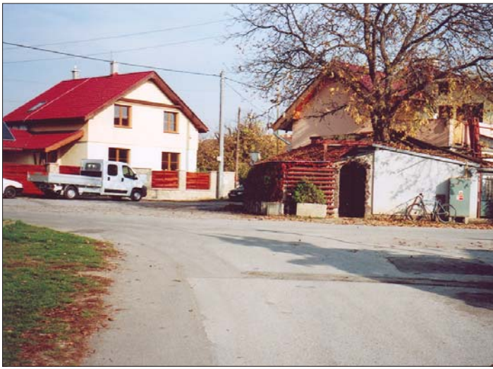
Pohľad na časť Edisonovej ulice, vpravo pohostinstvo „Hegi, pod orechom“, o čosi ďalej predajňa potravín a zmiešaného tovaru Terézie Figurovej.