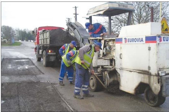
Na Opátskej ulici pri otočke autobusu MHD pracovníci firmy Astex, s.r.o. pri asfaltovaní. Komunikácia tohto nového úseku má dĺžku 186 m.