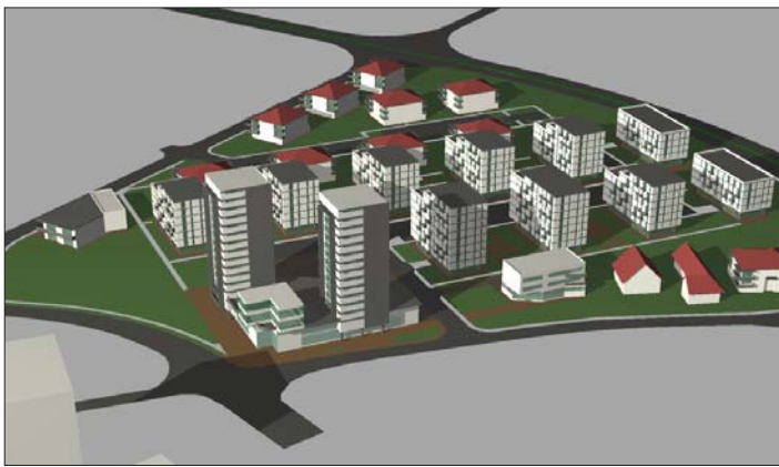
Takto by v budúcnosti mala vyzeráť lokalita „Golianova“