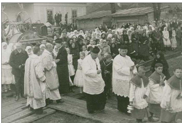
Touto fotografiou vám približujeme chvíľe, keď sa kládli základy nášho kostola sv. Cyrila a Metoda. Bolo to v novembri 1934.