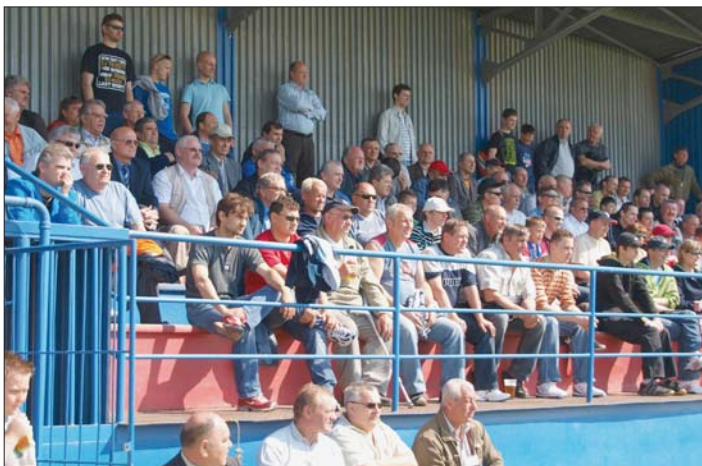
Verní fanúšikovia nášho futbalového klubu nechýbali ani na dueli MFK Krásna-Bardejov 3. mája 2009.