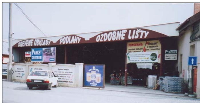
Pohľad na objekt firmy z cesty smerujúcej k Nižnej a Vyšnej Hutke a na Slanec, ktorá tu vyrástla takpovediac „na zelenej lúke“.

Nájsť jej šéfa v takej trme-vrme je viac ako nájsť ihlu v kope sena. No ale podarilo sa a tak bez dlhého otáľania sme mu položili niekoľko otázok, týkajúcich sa zrodu firmy, jej začiatkov aj to, prečo mu učarilo práve drevo, ako hlavný artikel, čo všetko má naporúdzi pre svojich zákazníkov i to aká je spätná väzba na poskytované služby, ako reaguje na dopyt kupujúcich, aj to, čo mu strpčuje život, ako tomu čelí a čo robí pre spokojnosť svojich klientov.