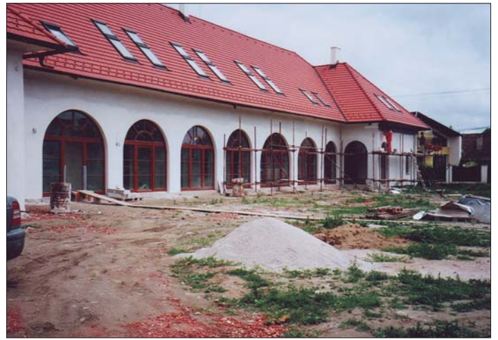
Tesne pred uzávierkou čísla sme urobili tento záber z kúrie, kde sa práce na omietkach dostávajú do cieľovej rovinky.

Ešte zopár zaujímavostí: Ak máte viac ako 35 rokov, dôchodok s pomocou DSS sa Vám nezvýši. Ak zarábate menej ako 600 eur (18 000 Sk), účasť v II. pilieri sa Vám neoplatí. Ak sporiteľ vystúpi z II. dôchodkového piliera, peniaze sa z jeho dôchodkovej správcovskej spoločnosti prevedú na účet Sociálnej poisťovne. Od toho okamihu sa na poistenca pozera Sociálna poisťovňa tak, ako keby nikdy nebol sporiteľom. Ak však už ide o sporiteľa, ktorý je poberateľom starobného alebo predčasného starobného dôchodku, (pri stanovení výšky ktorého musela byť zohľadnená skutočnosť, že bol sporiteľom a jeho dôchodok mu bol znížený), po jeho výstupe z II. piliera a potom, ako sa pripíšu jeho prostriedky z II. piliera na účet Sociálnej poisťovne, znovu sa mu vymeria jeho dôchodok tak, ako keby v II. pilieri nikdy nebol. Našetrené peniaze v DSS Vaše deti nezdedia. V II. pilieri