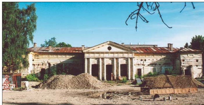
Súčasný pohľad na severnú časť kaštieľa, ktorý čaká na svoju záchranu.

ní pracovníci vás ochotne spoja s konkrétnym pracovníkom miestneho úradu. Tí, ktorí máte prístup na internet môžete svoje pripomienky a požiadavky vybaviť aj priamo na mailovej adrese kosicekrasna@kosicekrasna.sk . Funkcia starostu je aj o častom cestovaní mimo úradu a zastupovaní Krásnej pri rôznych zasadnutiach orgánov mesta a správnych konaniach na magistráte alebo iných špecializovaných úradoch miestnej alebo ústrednej štátnej správy. Preto vás chcem poprosiť, aby v prípade, že niektoré vaše problémy potrebujete priamo konzultovať a vybaviť so starostom, svoju požiadavku povedzte zamestnancom úradu. My sa vynasnažíme v čo najkratšom čase dohodnúť konkrétny termín nášho stretnutia. Samospráva, starosta, poslanci, ale aj zamestnanci miestneho úradu sú tu predsa pre vás a nie naopak. Hľadajme teda spoločné body záujmu a niť spoločného porozumenia.