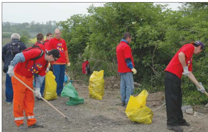
V rámci dobrovoľníckych prác k nám v máji t.r. zavítala 30-členná skupina z košického US STEEL-u, ktorá pomáhala pri úprave cyklistického chodníka a pri zbere odpadu okolo Hornádu.