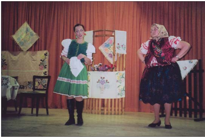
Jedna zo scén našich ochotníkov v divadelnej hre „Ženský zákon“, s ktorou sa predstavili doma, v Ťahanovciach, ale aj v Trebišove.