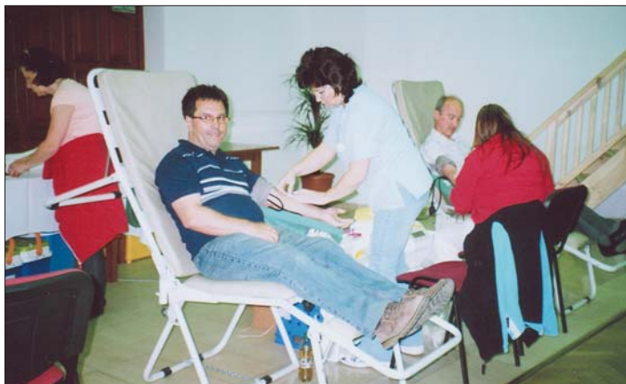
A tak to vyzeralo v kreslách na odber vzácnej tekutiny, do ktorých sa na siedmom ročníku „Krásňanskej kvapky krvi“ posadilo 21 darcov.