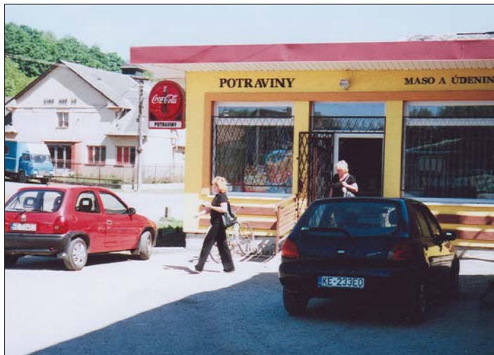
Pred vchodom do novej predajne je rušno vo všedný aj sviatočný deň.

z biologických potrieb. Kto z nás nepozná kolotoč nákupov aj iných druhov potravín, bez ktorých sa nezaobíde žiadna domácnosť? Každý deň, sviatok či piatok počnúc raňajkami, končiac večerou vždy je potrebné schytať čosi pod zub. Ba ani po večeri si nedáme pokoja, vždy čosi hľadáme na „zobnutie“ pri televízore až kým nás neskláti menej vzrušujúci program. Veď to poznáte : keksiky, čokoláda, zemiačky, tyčinky, bonbonierka, ale aj dúšok nejakého nápoja sa