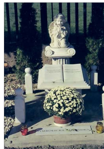
Naša „Symbolická záhradka“

• Dôstojne a s úctou sa vyrovnajme s realitou smrti.