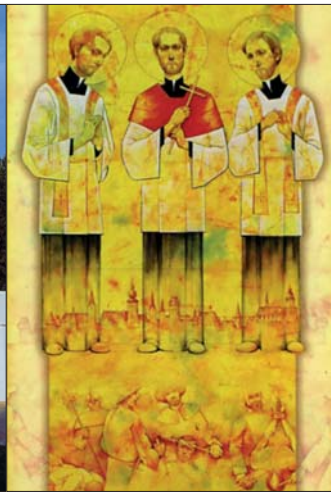
Kostol svätých Košických mučeníkov Marka Križina, Melichara Grodzieckého a Štefana Pongrácza, kňazov a mučeníkov.