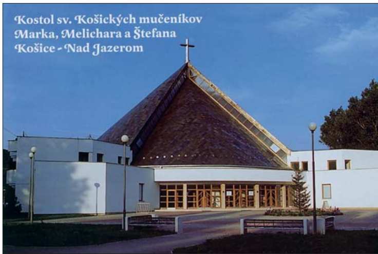
Kostol sv. Košických mučeníkov Marka, Melichara a Štefana Košice - Nad Jazerom