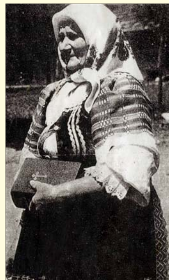
Jediná vec, ktorá príde k človeku sama, je staroba. (bj)

V mene redakčnej rady nášho spravodajcu všetkým seniorom Krásnej želáme, aby ich dni boli naplnené zdravím, šťastím a spokojnosťou. (mm)