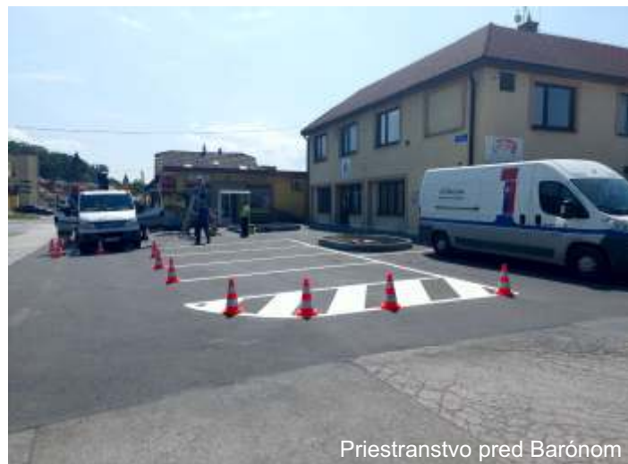
Priestranstvo pred Barónom

Chcel by som informovať čitateľov, že príprava opráv komunikácií u nás v Krásnej prebieha dlhodobo a detailne. Nie je to vôbec tak, že nalepíme asfalt na jestvujúci. Snažíme sa čo najviac a efektívne rozhodnúť, do ktorej strany bude cesta sklonená (alebo na obe strany), identifikovať