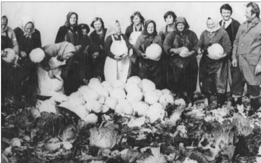
Zásobárňou vitamínov pre obyvateľov krajskej metropoly – Košice v sedemdesiatych rokoch bolo veľkoplošné zeleninárstvo za železným mostom v Krásnej nad Hornádom. Pri chystaní kapusty na expedíciu vidíme členky zeleninárskej skupiny. Spoznávate ich?