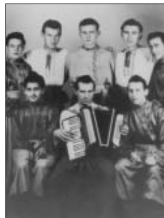
Niekdajší tanečníci ukrajinských tancov pri Osvetovej besede v Krásnej z päťdesiatych rokov

Košice - mestská časť Krásna leží 191 m nad morom. Najstaršia písomná zmienka je z roku 1143, kedy bolo vysvätené krásňanské opátstvo - benediktínsky kláštor s patronáciom P. Márie. Už v čase jeho rozvoja tu vznikli dve samostatné dediny Krásna a Opátska, v stredoveku známe vinohradníctvom. Krásna nad Hornádom vznikla spojením už spomínaných obcí v roku 1945. Súčasťou mesta Košice sa stala v roku 1976. Heraldická komisia v roku 1997 potvrdila Krásnej erb a zástavu.