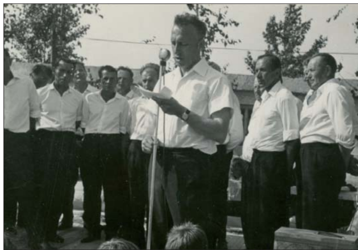
Na verejných podujatiach nikdy nechýbal ani náš mužský spevácky zbor, ktorý tvorili prevažne seniori. Bol to pre nich zdroj nádherného pocitu seberealizácie, najmä pri verejných vystúpeniach. Snímka je z dožiniek v roku 1964 na miestnom ihrisku.

vokálnych zborov svetových skladateľov, ktoré v ľudoch zanechali hlboký umelecký zážitok. Popri vydávaní miestnych novín „ Krásňanske zvesti “, organizovaní vzorových podujatí, na ktoré prichádzali pracovníci kultúry z ostatných strediskových obcí na skusy, naplno žili aj spoločenské organizácie, požiarnici, jednotári, červeno-križiaci, mládežníci, zväzarmovci aj odbojáři. Všetci prispeli k rozvoju bohatého kultúrno-spoločenského života v obci. Navyše bolo množstvo výletov, odber najcennejšej tekutiny, ale aj starostlivosť o hroby padlých v druhej svetovej vojne. Vari aj to prispelo k tomu, že v rozpätí spomínaných rokov okresné orgány zhodnotili našu kultúrno-osvetovú inštitúciu ako najkonsolidovanejšiu v okrese Košice-vidiek.