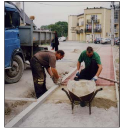
Okrem iných naliehavých prác v Krásnej na rad prišiel aj chodník na Opátskej ulici. Povedie od nášho miestneho úradu po odbočku na Horu.