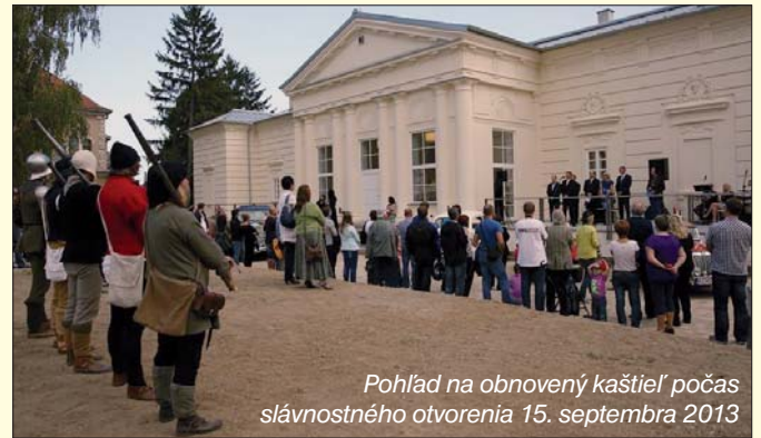
Pohľad na obnovený kaštieľ počas slávnostného otvorenia 15. septembra 2013