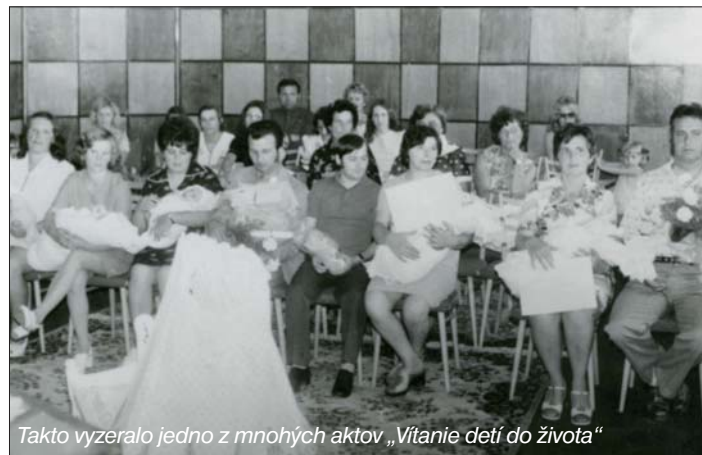
Takto vyzeralo jedno z mnohých aktov „Vítanie detí do života“

zväzky. To isté možno tvrdiť aj o estrádnych vystúpeniach. Po niekoľkých reprízach na domácej pôde, nasledovali zájazdy do okolitých obcí, ba aj za