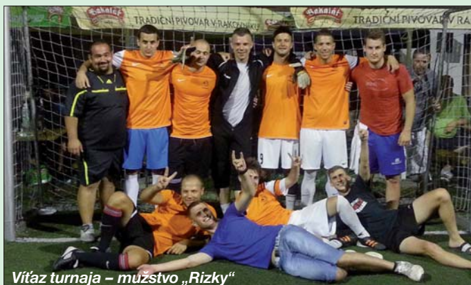
Víťaz turnaja – mužstvo „Rizky“