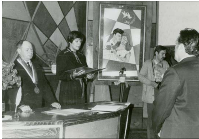
„V dobrom i v zlom, spoločne životom“. Také bolo motto na čelnej stene našej „sobášky“. Fotografia je z obradu civilného sobáša.

Naplno sa rozprúdila kurzová činnosť – kurzy varenia, pečenia, strihov a šitia, vyšívania, spoločenského správania pre cigánskych spoluobčanov, hudobná výchova, najmä hra na klavír, harmoniku, gitaru, všetko v kooperácii s Domom kultúry a vzdelávania v Košiciach, Akadémiou vzdelávania, či Ľudovou školou umenia v Košiciach a Jednotou SD z hľadiska zabezpečovania učiteľov hudby, inštruktorky na kurzy varenia