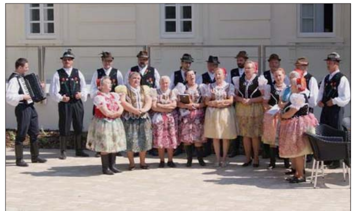
Dňa 7. júla 2013 v rámci projektu Čítanie v piesku času DFS Krásňanka opäť zažiarila. Okrem piesní pridala aj čítanie historických príbehov a výňatky z histórie Krásnej a kaštieľa.

• Prekonať zlé návyky sa dá len dnes, nie zajtra!