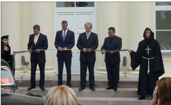
Slávnostné otvorenie krásňanskeho kaštieľa dňa 15. septembra 2013 začalo prestrihávaním pásky čelnými predstaviteľmi mesta Košice a našej mestskej časti.