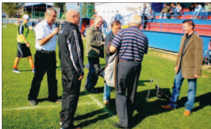
Starosta s ďalšími funkcionármi počas odovzdávania propagačných materiálov našej MČ vyzrebovaným divákom.

Ich pôsobenie v jesennej časti treba vyzdvihnúť, keď zo 14. družstiev sú na 1. mieste s 5 bodovým náskokom a impozantným skóre 83:21. Toto postavenie ich však zaväzuje, aby v takom duchu pokračovali aj v jarnej časti a dobrými výkonomi potvrdili postup do vyššej súťaže. Vladimír Wantruba