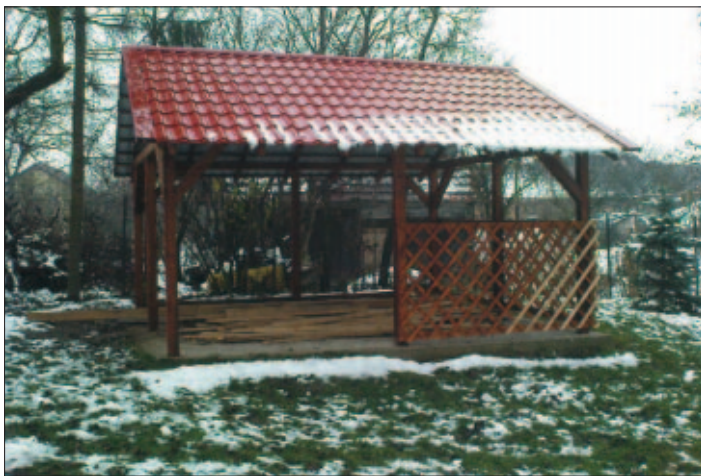
Nový altánok v našej materskej škole, o ktorom sme písali v minulom čísle, predčasom ukončili za výdatnej pomoci rodičov detí, ktoré navštevujú predškolské zariadenie.