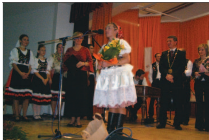
Vedúca Krasňanky ďakuje všetkým, ktorí sa pricinili o dôstojný priebeh desiatich narodenín „jej“ súboru.

Vážim si ich prácu, ktorú doteraz pre súbor urobili a tak prezentovali nielen seba, ale aj našu obec.