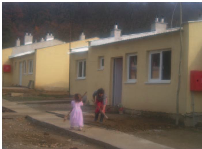
Domčeky v Jasove. O výstavbu podobných sa usilujeme v spolupráci s hlavným architektom mesta aj v Krásnej pre našich rómskych spoluobčanov z Vyšného dvora.