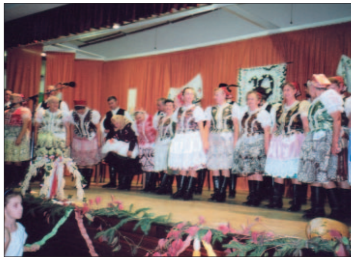
Na záver nevšednej slávnosti sa opätovne prišli predstaviť svojmu vďačnému publiku členovia Krasňanky

pódium nastúpili „Siplacke hlopi“, ktorí udali „tón“ slávnosti svojimi ťahavými i rezkými pesničkami. V zápätí sa domáci súbor predstavil pásmom „Dožinky“ a po oslave chleba na scéne sa objavili členovia hosťujúceho súboru „Hutčianka“, ktoré zaujali svojim vtipným vystúpením pod názvom „Páranie peria“ a ktoré sa nezaobišlo bez úsmevných dialógov, prílehavých pesničiek a tancov, čo na páračkach nikdy nesmeľo chýbať. Oživením popoludnia bolo aj „čarovanie“, zvyky a obyčaje, aké sa zachovali vďaka súboru z Košickej Belej. Po „Pantličke“ a „Belanských parobkoch“ na pódium opäť prišli naše ženičky a chlapi v krásnych dobových krojoch, aby ukázali, čo všetko sa dialo, keď prišiel na svet nový človečik. O tom sme sa dozvedeli v pásmo „Kersciny“, na ktorých nikdy nechýbalo úsmevné, ale aj váž-