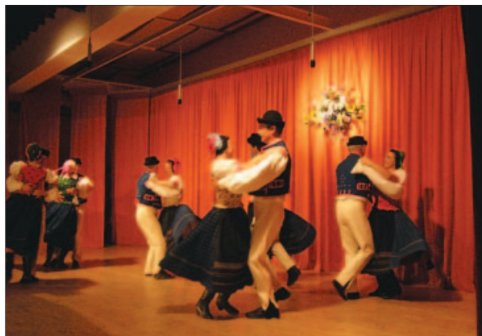
Do pevnej podlahy nášho javiska „dupali“ aj tanečníci z Jakuban.

sme sa svedkami rýdzich, originálnych, svojráznych piesní a tancov, ktoré si zachovali svoj prirodzený charakter ľudovej kultúry. Tie nám predviedli folklórne súbory z Košíc, Prešova, Michaloviec, Prievidze, Čačiny zo Spišskej Novej Vsi, Jakuban, Hornádu, Omladiny, Železiara i Železiarika z Košíc a tiež súboru Zemplín z Michaloviec.