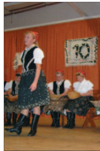
Scénka z „Párania peria“ folklórného súboru Hutčianka, ktorý prišiel pozdraviť našu „jubilantku“

a cimbalová muzika Železiar vo forme rezkých východniarskych tancov. Po ňom ešte nasledovalo záverečné vystúpenie Krasňanky, spojené s poďakovaním a gratuláciami