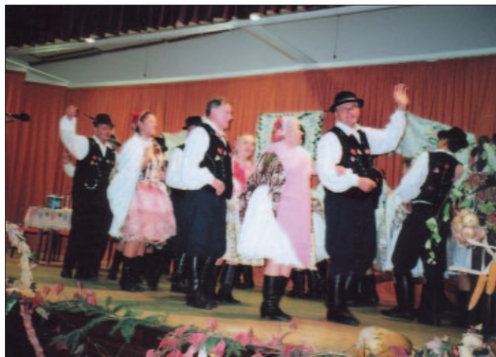
Záverečná scéna našej Krasňanky v pásme „Kersciny“

ťazkách na domácej pôde, ale aj na pódiumoch iných obcí, samozrejme v krajskom meste Košice, ba aj v televíznej relácii „Kapura“. V lete dokonca zavítali aj do Chorvátska.