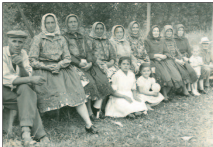
Naše mamy, staré mamy, možno aj prababky na jednom z mnohých výletov, ktoré v tom čase organizovala Jednota SD v Krásnej.