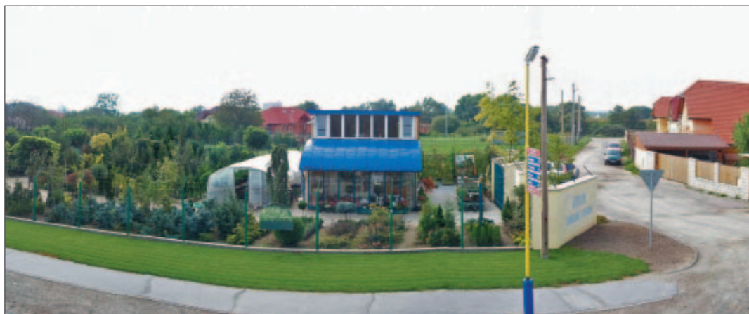
Átrium – záhradné centrum na Beniakovkej ulici, ako ho máme možnosť vidieť z hlavnej cesty.