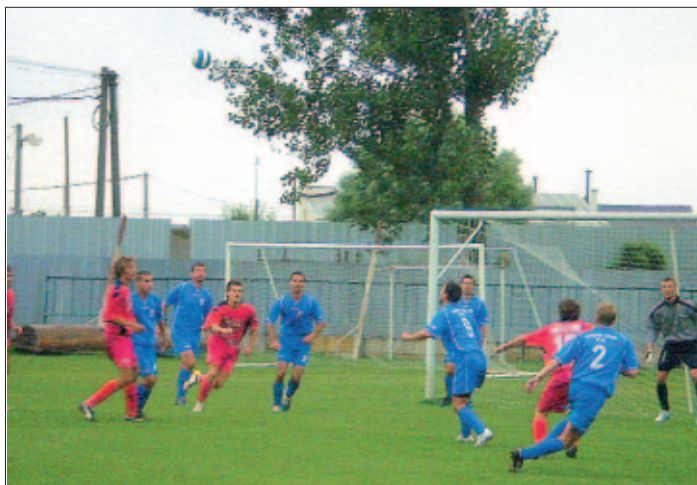
Z futbalového zápasu MFK Košice – Krásna – FK Vysoké Tatry (0:2)

Celkove však treba konštatovať, že naše mužstvo vo väčšine zápasov podávalo dobrý výkon, keď bolo potrebné hlavne ak sa