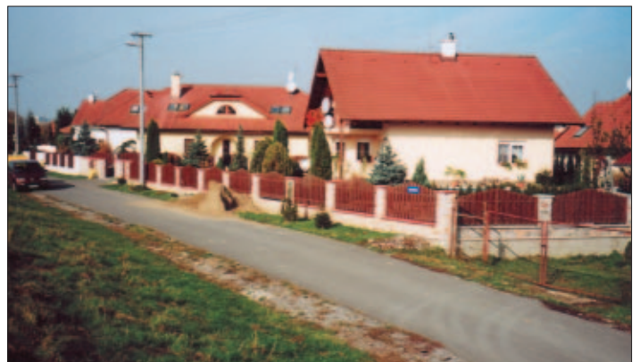
Jedna z nových ulíc Krásnej, ktorú lemujú novovybudované rodinné domy v blízkosti zurčiaceho Hornádu je Beniaková

A tak odporúčam, aby sa dobré skutky tých, ktorí cítia k svojmu časopisu o trochu viac ako ostatní, neznehodnocovali, aby neboli „jedom“, ale medom, lebo tie sa stávajú jedom iba v srdci zlého človeka! Stavajme mosty a cesty, nekladme prekážky! Nikto nikomu nemusí nič závidieť, tobôž nie intrigovať a už vonkoncom nepripúšťam slovko nenávisť, ktorá vždy má tendenciu tiecť žilami ako oheň zápalnou šnúrou! Každý sa má možnosť „zviditeľniť“, ak má dobrú vôľu, chuť a elán, ale