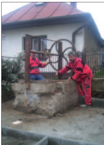
Tak vyzerala pred renováciou...