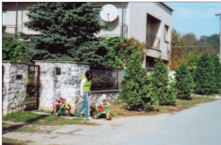
Jedna z pekných ulíc Krásnej „Pri Hornáde“ počas letných dní

A čo na záver? Na sklonku roka 2008 aj v polceste volebného obdobia vyjadrujem presvedčenie, že všetci sa vynasnažíme byť k sebe lepší a tolerantnejší a že našim krédom bude najmä toľkokrát skloňovaná láska. To by malo byť smerovkou k naplneniu našich snov, túžob a predsavzatí aj pre nastávajúci rok 2009. Napokon ani tri slová nad hlavičkou dnešného Krasňančana nie sú náhodilé. Sú to tri „klúčiky“, ktorými dokážeme odomknúť všetky dvere a rozlomiť aj tie najťažšie okovy.