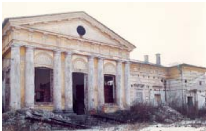
Takýto je súčasný stav kaštieľa, ktorý by mal povstať z ruín. Dole jedna zo študentiek pri archeologickom výskume omietok múrov nášho kaštieľa z 18. storočia.

„Tento kaštieľ je vo veľmi zlom stave, snažíme sa ho preskúmať, aký je starý a zároveň akým spôsobom je možné uskutočniť obnovu, aby zostal zachovaný štýl, v ktorom bol postavený. V suteréne sú renesančné klenby, na ktorých je ešte vidieť šalovanie. Prízemie bolo postavené