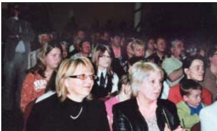
Tanečné výkony najmenších účinkujúcich, mamičky, ale aj ockovia a babičky tentoraz oceňujú potleskom, najmä za pesničku „Jeden pomaranč sa zaľúbil...“

rom sa predstavili najmenší škôlkári z oboch materských škôl. Po nich sa slova ujali starší žiaci zo ZŠ a MŠ sv. Marka Križina. Opäť tu znelo milé slovo, básničky, spevy, tance, z ktorých uvili veľkú „Kyticu pre mamu“. Tú venovali v tento deň svojim mamičkám, ale aj ockom a babičkám, ktoré ich v hojnom počte prišli vypočuť a povzbudiť. Najviac však vo svojom pásme bolo skloňované slovo mama, lebo