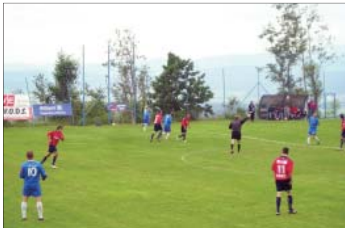
Posledný majstrovský futbalový zápas tretej ligy medzi mužstvom Vysoké Tatry a naším futbalovým klubom, ktorý skončil remízou 2:2.