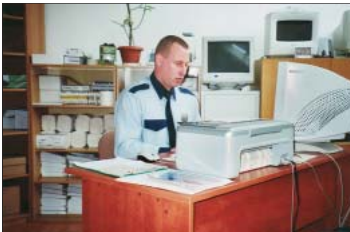
Čo zistí, prešetrí či zariadi pri svojej hliadkovej činnosti, to aj zaznamená, prípadne navrhne riešenie, čo je zjavné aj z nášho záberu z jeho pracovne na Miestnom úrade MČ Košice-Krásna.