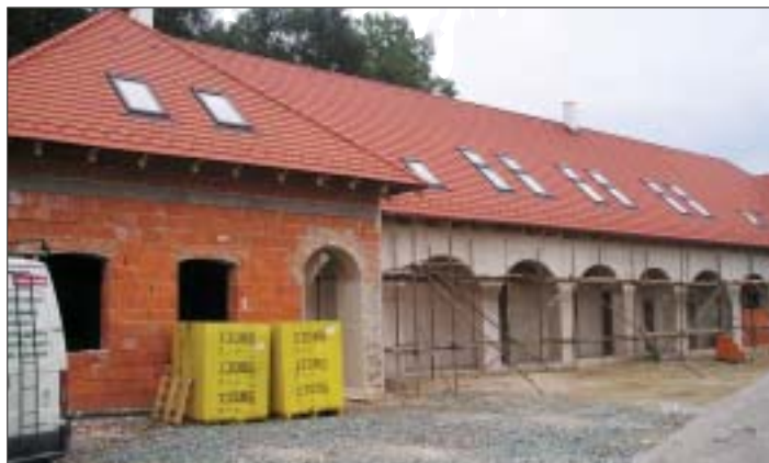
Postupne sa vracia dávna podoba Zemianskej kúrie do pôvodného stavu.