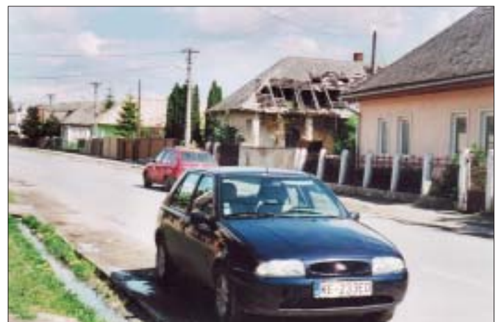
Aj takúto „ozdobu“ máme na našej hlavnej ulici. Ide o rodinný dom na Lackovej 26, ktorý nielenže nepôsobí esteticky, ale vážne ohrozuje susedov.

• Ak chceš urobiť človeka šťastným, nepridávaj nič k jeho bohatstvu, ale odober mu niektoré z jeho želaní.