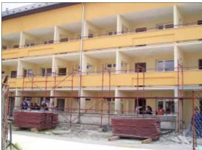
Takto vyzerá vynovená bývalá sociálna bytovka na Golianovej ulici. Z jej ukončením počítame v júli tohto roku.