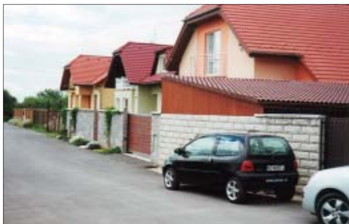
Jedna z ulíc, ktoré v ostatnom čase „vyrástli“ v nových stavebných lokalitách, je aj Beniaková oproti Záhradného centra

(Poznámka pre tých, ktorí sa neučili latinčinu: c čítajte k, ae - e, iu - ju) Pripravil: (bj)