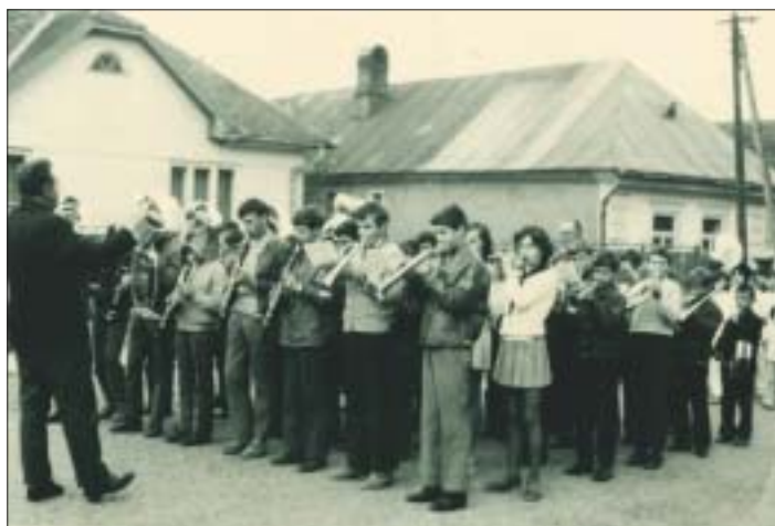
Kedysi, presnejšie v roku 1973, sme v Krásnej mali aj mládežnícku dychovku, ktorá spríjemňovala chvíle sviatočných dní. Čo keby sme „oživilí“ v našej mestskej časti aj túto tradíciu? (bjč)