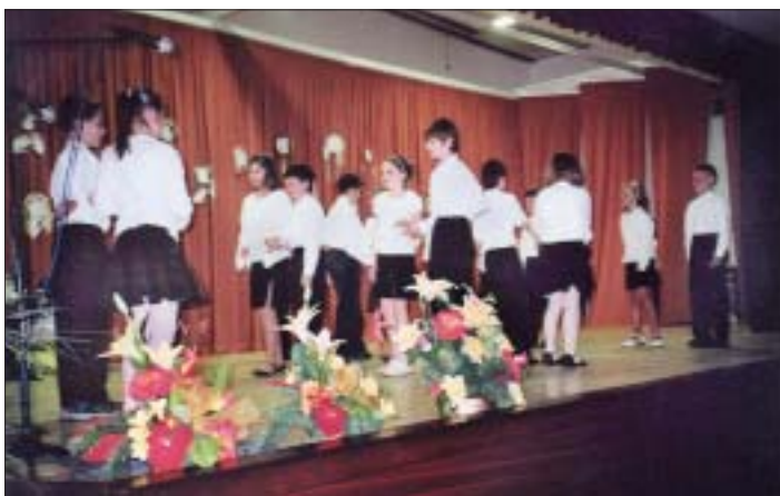
Na oslavách Dňa matiek, starší žiaci našej školy zaujali priliehavými básničkami, spevom, ale aj tancom.