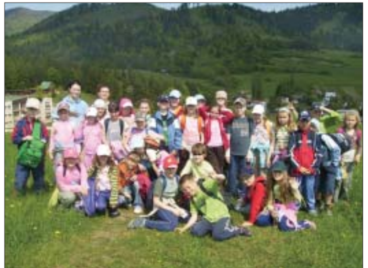
Žiaci 3. a 4. ročníka našej ZŠ so svojimi triednymi učiteľkami.