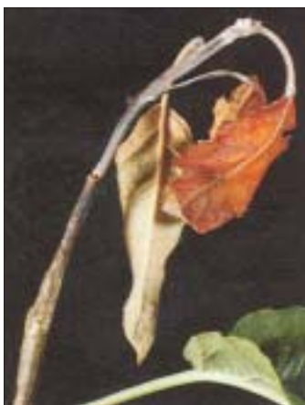
Príznamy spály môžeme vidieť aj na koncoch výhonkov, ktoré sa hákovite ohýbajú.

Aj na území Slovenska bol už v minulých rokoch zaznamenaný lokálny výskyt veľmi nebezpečnej karanténnej choroby - bakteriovej spály jadrovín - spôsobujúcej rýchle odumieranie napadnutých konárov, ale i celých rastlín.