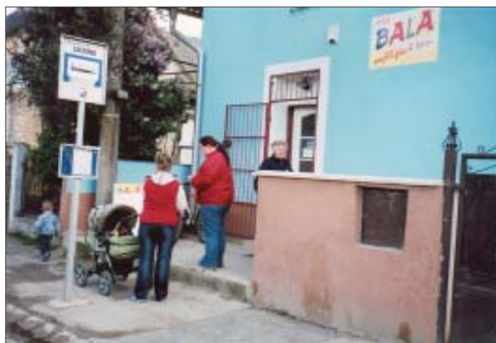
Tento záber je zo vstupu do obchodu z našej hlavnej ulice.