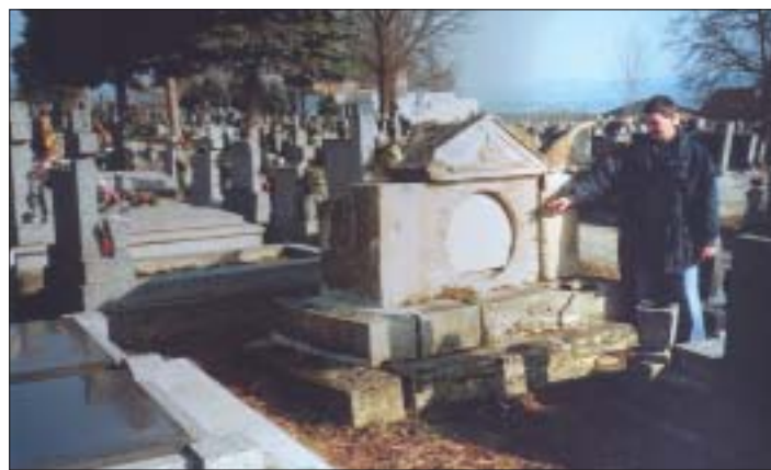
Pohľad na časť nášho cintorína. Vzdať úctu každý, kto ideš popri ňom tým, ktorí nás predišli do večnosti.