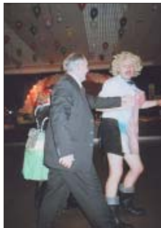
„Mne še dobre tancuje aj v gumákoch... Ne Pali?“