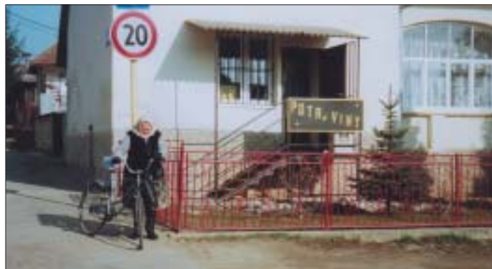
Jedna zo šiestich predajní potravín je aj na Smutnej ulici, smerom na cintorín

Mrzí nás a výslovne hnevá, že každú jar sa so železnou pravidelnosťou v Krásnej opakuje nekonečný príbeh vytvárania nelegálnych skládok komunálneho a stavebného odpadu. Najčastejšími chronicky zaťaženými lokalitami sú odbočka na Rešov majer, cesta okolo bývalého družstva na V. Hutku, okolie železničného mosta, priestor za protipovodňovým múrom pri Hornáde v lokalite ulice Za mostom. Pýtať sa a zisťovať kto to robí je na mieste vždy a v každom čase, ale tak ako každý rok vašim voleným zástupcom neostáva nič iné len skládka z našich spoločných rozpočtových peňazí odstrániť. V súčasnosti pri týždennom zbere komunálneho odpadu, pravidelnej organizácii zberu nadrozmerného a nebezpečného odpadu, je dôvod takéhoto konania tzv. „vedomelých“ občanov neznámy a nepochopiteľný! Myslím si, že policajti a uloženie sankcie všetko nevyriešia. Poriadok, čistota a vzťah k prírode musí byť zakorenovaný hlboko v nás.