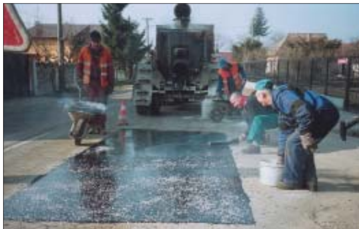
Pracovníkov firmy Aspron sme zastihli pri oprave cesty na Žiackej ulici, oproti farskému úradu a materskej školy.

Za pripomienky a za povzbudzujúce slová ďakujeme a veríme, že nabudúce už nebudete mať zábrany vyjadriť svoj názor aj takou formou, akú sme vám ponúkli, aj so svojím menom a fotografiou. šéfredaktor