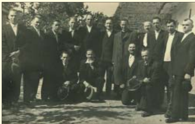
Na našej fotografii z domáceho archívu vidíme časť nášho cirkevného spevokolu na prelome tridsiatych až štyridsiatych rokov

• Mnohí ľudia si myslia, že majú dobré srdce, a zatiaľ majú len slabé nervy.