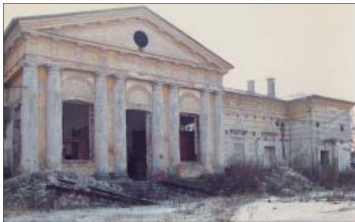
Takto vyzerá schátralý kaštieľ, ktorý čaká na svoju záchranu.