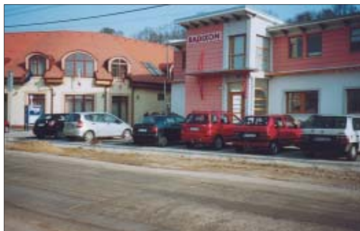
Vedľa novostavby nášho kultúrneho domu a miestneho úradu predčasom „vyrástla“ táto pekná budova počítačovej firmy Radixon, ktorá skrášľila centrum našej mestskej časti.