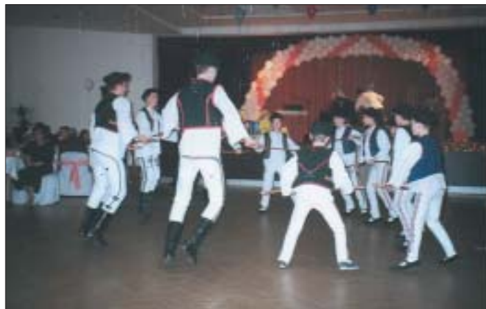
Popri našej „Krasňanke“ a skupiny „Drišľak“, nádhernými tanečnými variáciami a ľubozvučným spevom účastníkov bálu potešili aj tínedžeri Detského folklórneho súboru „Čarnička“.

• Po zlom nenastupuje vždy nutne dobré; môže ho vystriedať i nové zlo, horšie ako predošlé.