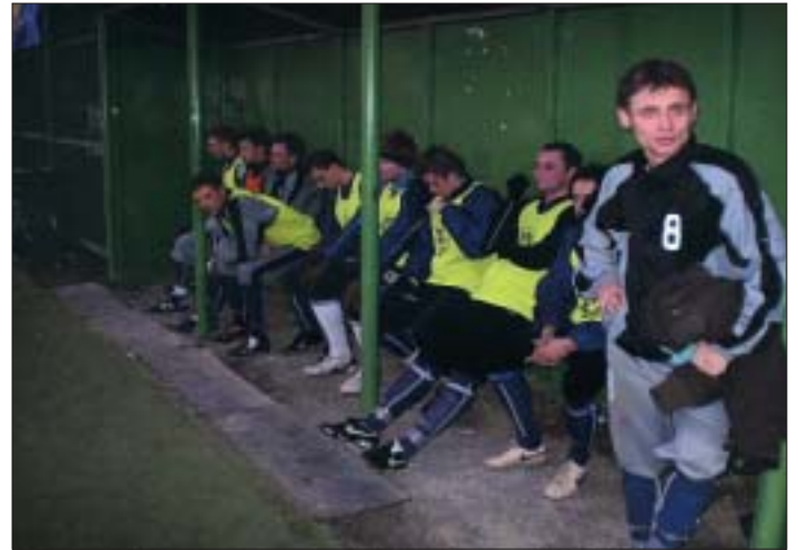
Náš záber je zo striedačky počas prípravného zápasu MFK Nižná Myšľa, ktorý sa hral na umelej trávě.