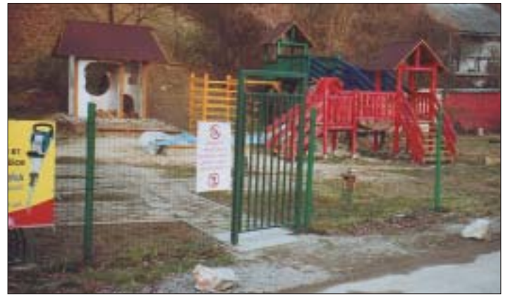
Pekné februárové popoludnie sme využili aj na „zmapovanie“ ulice 1. mája, kde sme okrem iného objavili nové detské ihrisko.

Predčasný starobný dôchodok - potrebný počet rokov obdobia dôchodkového poistenia na vznik nároku na predčasný starobný dôchodok sa tiež predlžuje z 10 na 15 rokov . Obmedzuje sa možnosť priznania starobného dôchodku v tom, že predčasný starobný dôchodok sa priznáva len poistencovi , ktorému odo dňa, od ktorého žiada predčasný starobný dôchodok priznať, chýbajú najviac dva roky do dovŕšenia dôchodkového veku. Naďalej sa zachováva podmienka, že suma predčasného starobného dôchodku musí byť vyššia ako 1,2 násobok sumy životného minima pre jednu plnoletú fyzickú osobu (ak je poistenec záro-