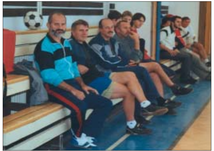
V Čanianskej telocvični počas prestávky nohejbalového turnaja na počesť Pavla Vébera.