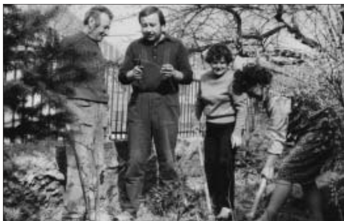
Naša snímka je síce urobená o čosi skôr, no jar bola taká istá ako dnes. A tá nás opäť láka do záhrad, aby sme urobili čosi pre budúcu úrodu. Kto ovláda rez ovocných stromov, ten orezáva, aj poučča. Kto to nevie, počúva a ryluje.