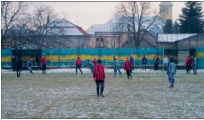
Záber zo zimného futbalového turnaja počas zápasu Krásna – Medzev na ihrisku v Čani.