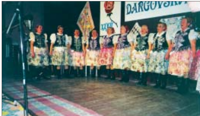
Z vystúpenia na okresnom kole „Dargovská ruža“ vo Svinici, 2002