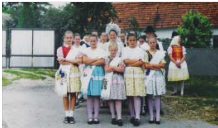
„Svadba“ je názov pásma, ktoré Krasňanka nahrala na kazetu za účasti členov súboru „Sedmokráska“ a folklórneho súboru „Hornád“