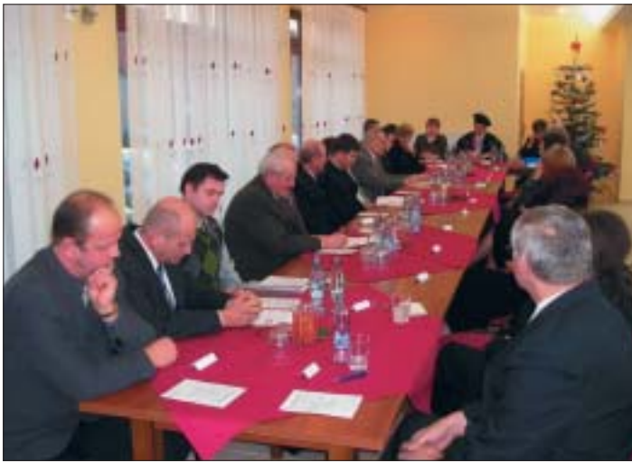
Pohľad na novozvolených poslancov MZ počas ustanovujúceho zasadnutia