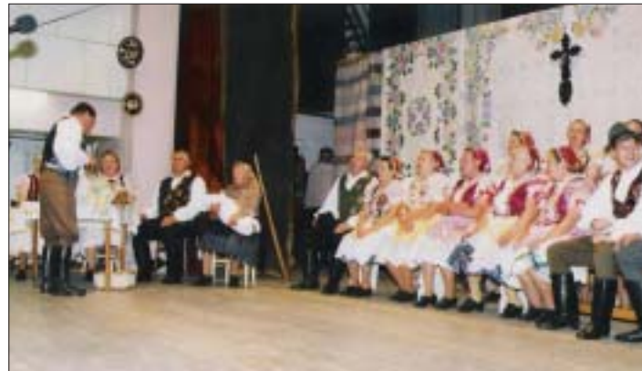
S pásmom „Krstiny“ sa súbor prezentoval v Družstevnej pri Hornáde, kde postúpil do krajského kola v Michalovciach