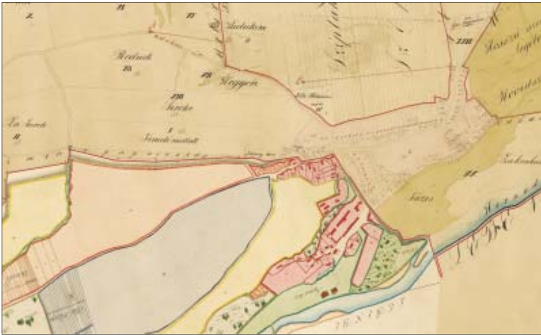
Spojené dve mapy (časti z nich): vľavo Széplak Apáthy a vpravo Széplak vytvárajú spoločnú Krásnu