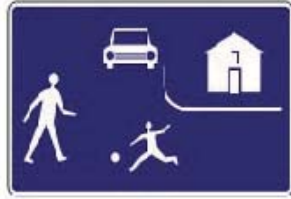
IP28a Obytná zóna

V obytnej zóne je státie vozidiel zakázané, ak dopravnou značkou nie je určené inak. V Krásnej máme obytnú zónu označenú