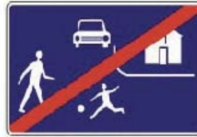
IP28b Konec obytnej zóny