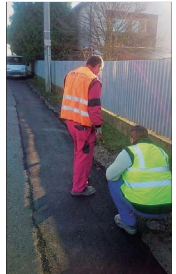
Posledné opravy ciest pred priechodom zimy. Tentoraz bola na rade ulica Ortoviská.