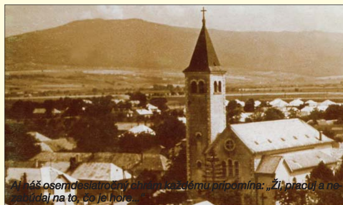
Aj náš osemdesiatročný chráam každému pripomína: „Ži, pracuj a ne-sobiľaj na to, čo je hore.“

vodlivosť v Kristovi Ježišovi. Svätosť nie je nič vzdialené, nič nedosiahnuteľné. Možno aj my poznáme takýchto svätcov v našom okolí, svät-