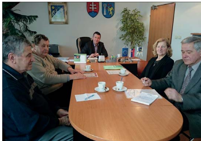
Na jednom z pravidelných stretnutí starosta so samosprávou krásňanských seniorov. Osobné dialógy sú vždy obojstranne osočné.