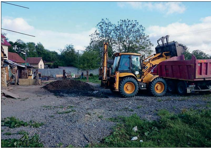
Náš záber je z prác pri likvidácii nelegálnych oplotení a čistenia Vyšného dvora.