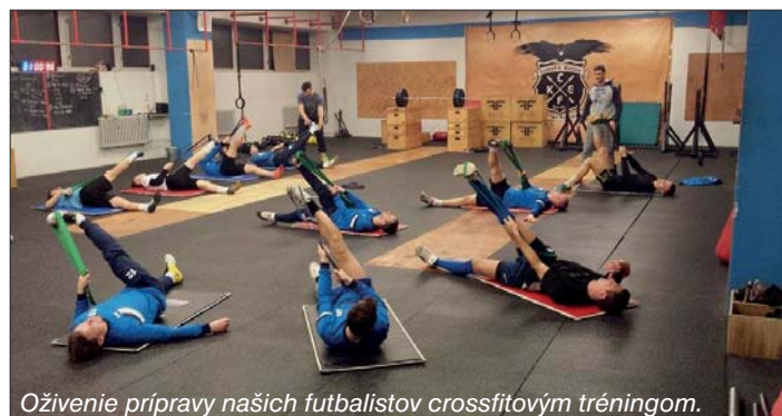
Oživenie prípravy našich futbalistov crossfitovým tréningom.

zimnú prípravu na jarnú odvetu 3. ligy TIPOS východ. Tá prebehla v dobrých podmienkach, skoro so 100% účasťou chlapcov, čo si tréner pochvaloval. Bola bez vážnejších zranení, či chorôb a chlapci majú za sebou kvalitnú prípravu. Káder pre jarnú časť sa veľmi nezmenil.