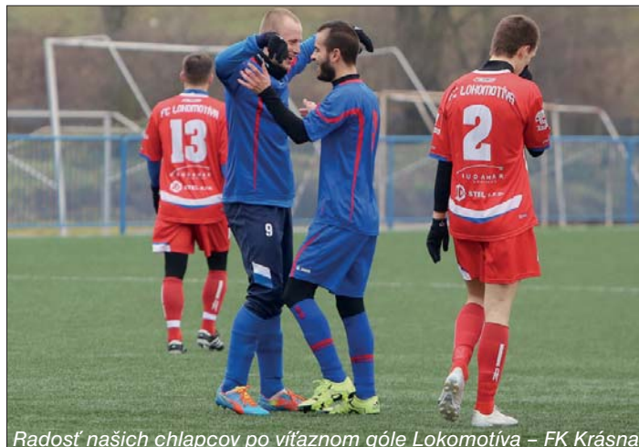
Radosť našich chlapcov po víťaznom góle Lokomotiva – FK Krásna