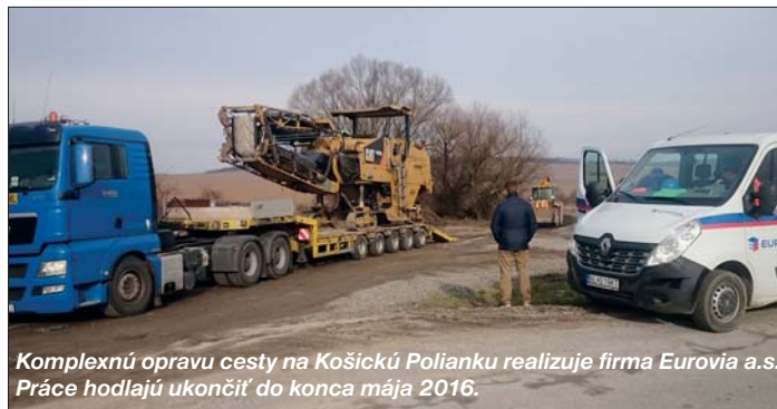
Komplexnú opravu cesty na Košickú Polianku realizuje firma Eurovia a.s. Práce hodlajú ukončiť do konca mája 2016.

si podotknúť, že v pláne nie je iba výmena asfaltového koberca, ale aj podložia, rígolov, ktoré sú jedným z najdôležitejších prvkov správneho odvodnenia celej komunikácie, aby jej stav, doslova a do písmena ako „tankodrom“ nebol hrozbou najbližšej budúcnosti. Termín ukončenia celkovej rekonštrukcie a jej kolaudácia je plánovaná do konca mája 2016. Aj touto cestou dovoľte mi poďakovať všetkým, ktorí ste svojim hlasom, občianskym a politickým postojom pomohli k tomu, že cesta na Košickú Polianku (najhoršia cesta v okolí Košíc) bude navždy minulosťou.