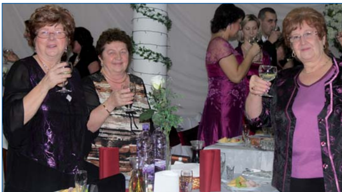
Na „Krásňanskom plese“ nechýbali ani naše seniorky, ktoré sme zastihli v družnej zábave, ale aj pri speve a tanci.

• I keď sa nedostáva síl, už sama vôľa je hodná chvály.