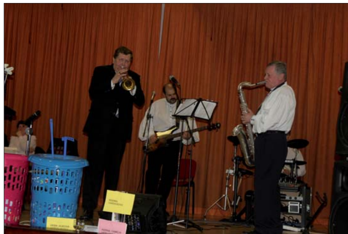
Na tradičnom predvianočnom podujatí „Sami sebe“, okrem iných súborov vystúpila aj naša hudobná skupina „Senior Bang Krásna“.