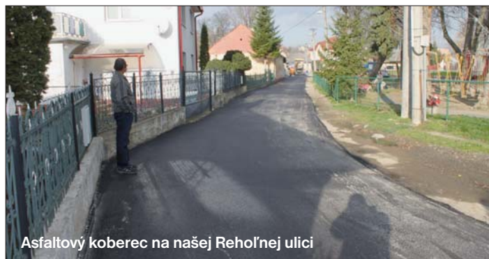
Asfaltový koberec na našej Rehoľnej ulici