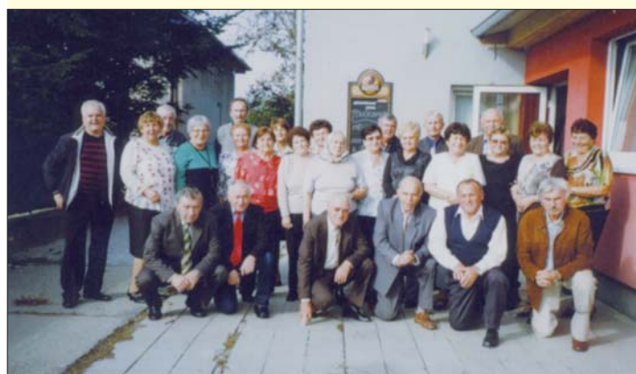
Prednedávnom sa po polstoročí stretli niekdajší žiaci, ktorí v školskom roku 1962/63 opustili lavice krásňanskej školy. Na zašlé roky strávené v škole i mimo nej si zaspomínali v jednom z našich reštauračných zariadení dnes už šesťdesiatpäťroční pamätníci.

• Všetko budúce je neisté. • Každý je kováčom svojho osudu.