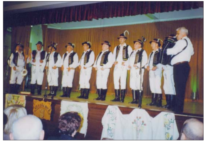
Hostami slávnostného programu pri príležitosti 15.výročia vzniku Krásňanky boli aj Folklórna skupina „Orgonina“ z Vranova nad Topľou a mužská spevácka skupina „Furmani“ z Trebišova. Bolo to skvelé oživenie programu, za čo si vyslúžili obdiv a uznanie divákov. Vďaka.