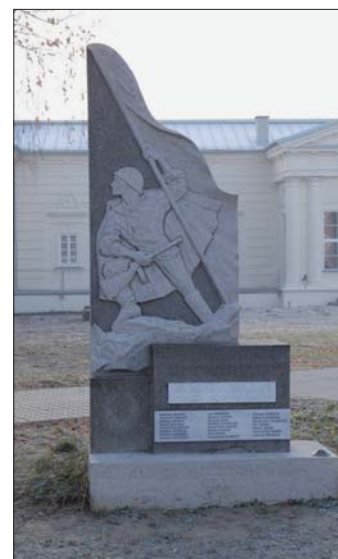
Pamätník padlým hrdinom obohatený o mená tých, ktorí položili životy za našu slobodu, na novom „Námestí svätých Cyrila a Metoda“ pred obnoveným kaštieľom.

V „dušičkové dni“, viac ako po iné všedné i sviatočné dni, naše myšlienky blúdia a uvažujú: Čo je smrť? Koniec alebo začiatok? Pre veriacich na tieto otázky dáva odpoveď dominantu nášho cintorína - kríž. Ten je symbolom utrpenia, smrti, ale aj večného života. Je povzbudením a nádejou, že s našimi drahými sa vo večnosti skôr či neskôr určite stretneme.