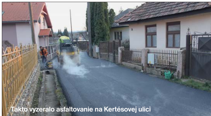
Takto vyzeralo asfaltovanie na Kertésovej ulici