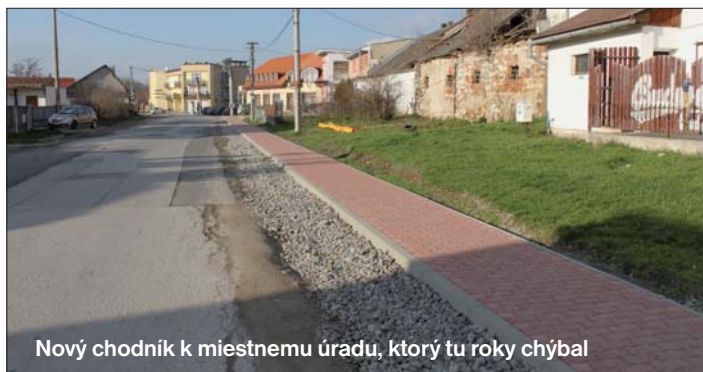
Nový chodník k miestnemu úradu, ktorý tu roky chýbal