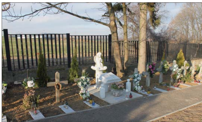
Takýto je aktuálny pohľad na našu „Symbolickú záhradku“.

K stretnutiu s Bohom nedochádza preto, aby sa človek zaoberal Bohom, ale preto, aby vydával svedectvo o svojom vzťahu k svetu. Každé zjavenie je výzvou a poslaním. (Martin Buber)