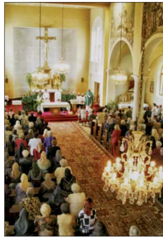
Takto vyzeral interiér krásňanskeho kostola svätých Cyrila a Metoda po maľbe v auguste 1982, teda pred tridsiatimidvoma rokmi. Vpravo: pohľad do vnútra nášho chrámu v roku 2005. Text k foto: (bj)