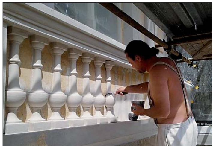
Posledné úpravy južnej, bohato zdobenej fasády v podaní reštaurátora z Banskej Bystrice. Ich pracovný deň zvyčajne končí až o 18. hodine.

Milí Krásňania, je tu leto, čas dovoleníek i školských prázdnin. Želám vám aj vašim deťom, aby ste ich prežili v plnom zdraví, šťastí a v pohode.